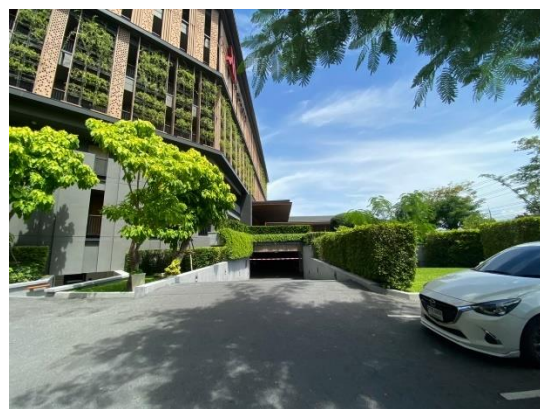
ภาพที่ 1.2-2 – สภาพโครงการปัจจุบัน